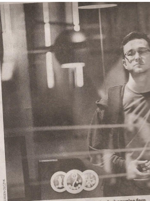
Großspuriges liegt ihm oliver-stone-untypischerweise fern

So hatte sich Snowden 2003 als Rekrut der US Army während eines Lehrgangs der Special Forces Erziehungsbüchse an beiden Beinen zugezogen. Seine militärische Karriere war damit frühzeitig beendet. Das ist eine Sache,